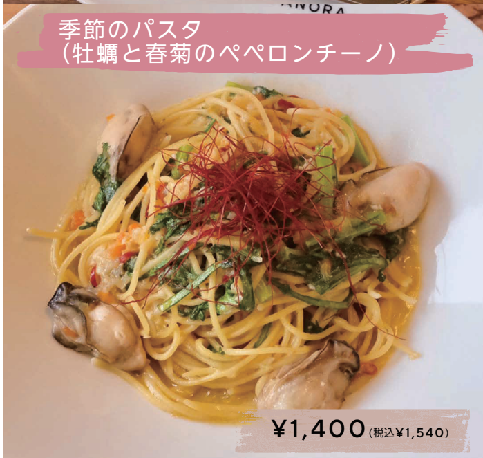
季節のパスタ (牡蠣と春菊のペペロンチーノ)