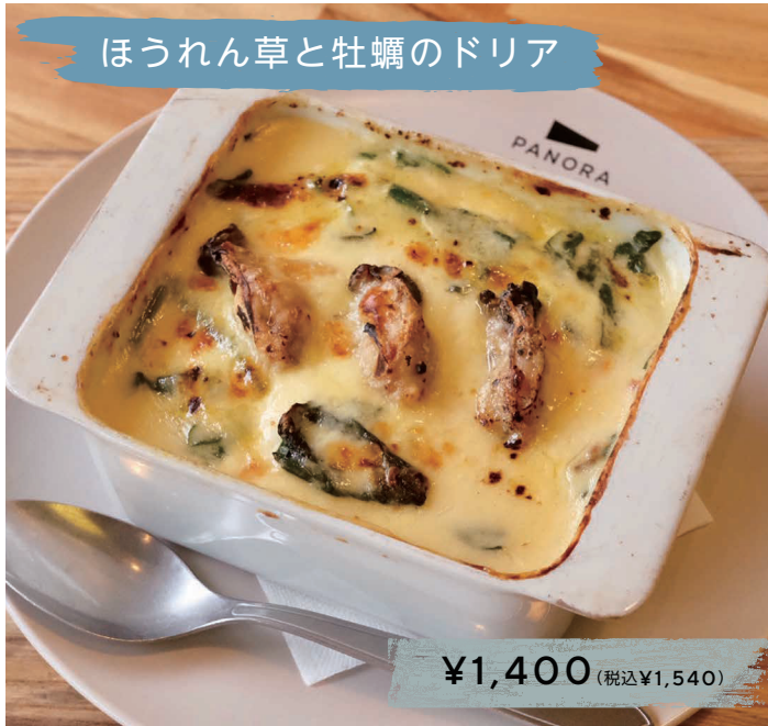
ほうれん草と牡蠣のドリア

2025.1.22 → 2.28 [ORDER ▶ 11:30 - L.O.16:30]