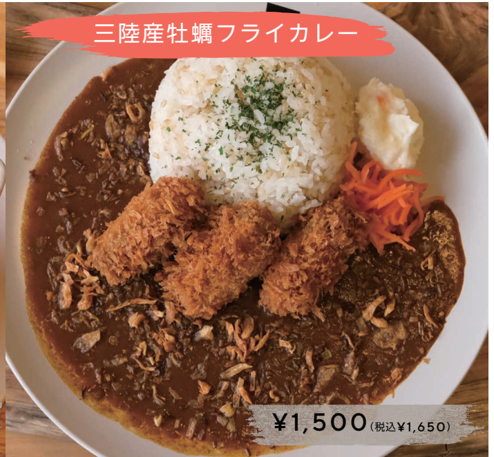
三陸産牡蠣フライカレー