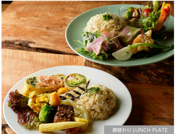
週替わり LUNCH PLATE