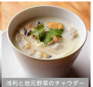
浅利と地元野菜のチャウダー

※ 食物アレルギーをお持ちのお客様がいらっしゃる場合は、スタッフまでお声掛けください。