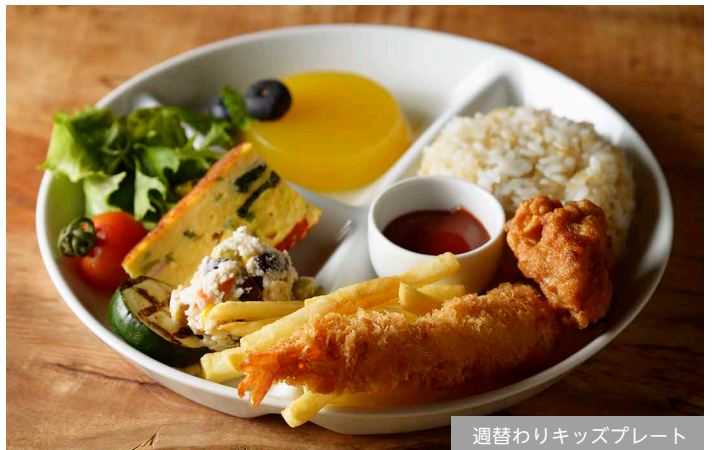
週替わりキッズプレート