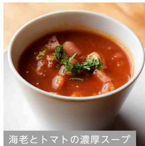
海老とトマトの濃厚スープ